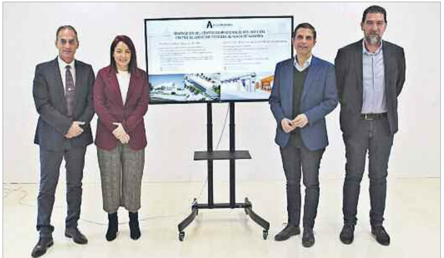
El alcalde, el vicealcalde, el segundo teniente de alcalde y concejal de Proyectos, y la concejala de Servicios Sociales, presentaron la remodelación del Centro Ocupacional El Molino y la adecuación para convertir el Centro de Servicios Sociales de Plaza de Navarra en un espacio totalmente accesible.

El Ayuntamiento de Alcalá obtuvo fondos europeos #NextGenerationEU gestionados a través del Plan de Recuperación, Transformación y Resiliencia del Gobierno de España para acometer ambos proyectos cuya inversión, en conjunto, asciende a más de un millón de euros.