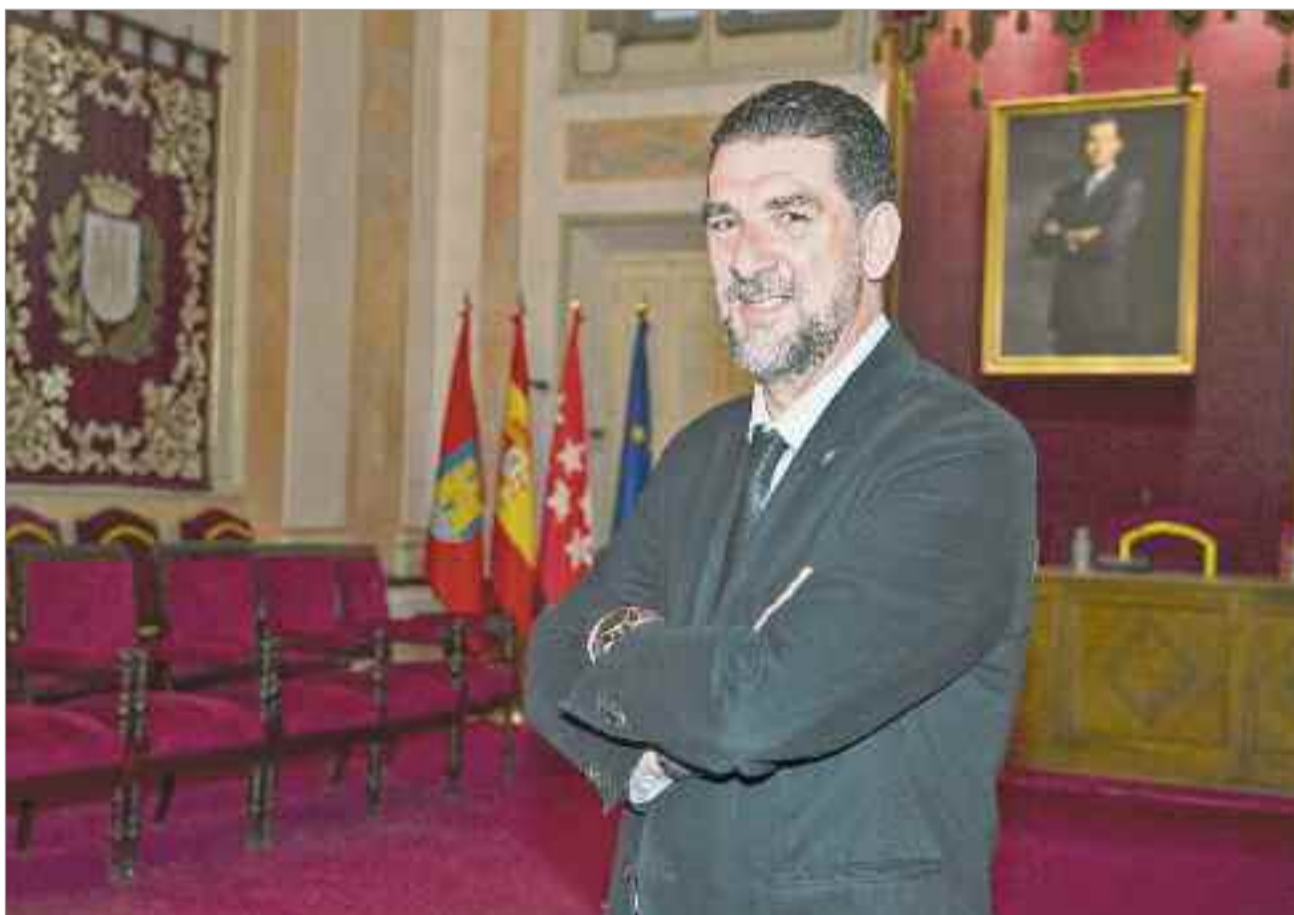
Nosotros como Partido Socialista tenemos una estrategia marcada para la ciudad de Alcalá, que la denominamos Por Alcalá, porque entendemos que nuestro nexo de unión y de trabajo es Alcalá, más allá de lo que suceda a nivel regional y nacional.

En materia de salud quiero destacar los Programas de Salud Mental dirigidos para jóvenes y también un curso gratuito de seis semanas para dejar de fumar. Quiero decir que hay muy poquitos ayuntamientos de la Comunidad de Madrid que den estos cursos de forma gratuita. Y, por supuesto, seguimos reclamando que en el Centro de Salud Luis Vives haya médico, para que los ciudadanos no se tengan que desplazar hasta el hospital, y ante la decisión del Gobierno regional de no incorporar el médico que teníamos antes de la pandemia. Así que el Partido Socialista, con el alcalde a la cabeza, seguirá reclamando el médico, porque es una demanda de miles y miles de vecinos y vecinas de Alcalá.