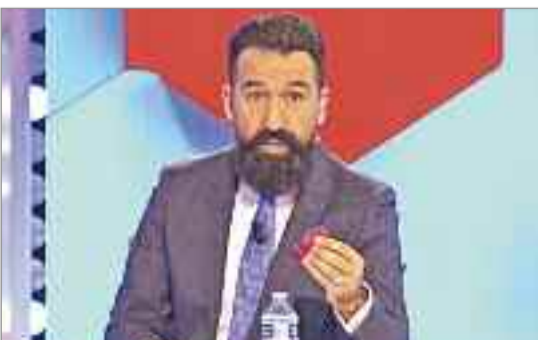
El humorista colgó el cartel de no hay billetes

El Teatro Salón Cervantes recibió al humorista Miguel Lago, con su espectáculo "Lago" La Comedia del Club, y se vendieron la totalidad de las entradas para asistir. El monologuista presentó en la ciudad complutense su nuevo espectáculo, una revolución del clásico unipersonal, que incluyó la presencia de teloneros de excepción para convertir al Teatro Salón Cervantes en un auténtico Comedy Club donde la función será única. Se trató de una genuina comedia servida con libertad, verdad y desnudez que busca la quinta esencia del formato.