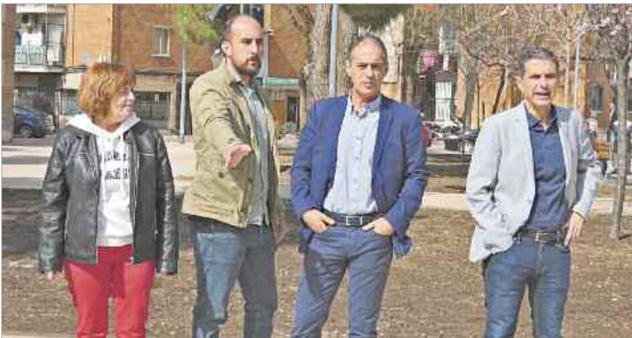
El alcalde de Alcalá de Henares, el vicealcalde, el concejal de Medio Ambiente, la concejala de Desarrollo Económico, y el concejal de Régimen Interior y Atención Ciudadana, visitaron el Parque de San Isidro que ha sido remodelado y dotado de más zonas verdes.

CARTAS AL DIRECTOR QUIJOTES Para participar en esta sección envíe sus cartas al correo electrónico revistaquijotes@yahoo.es