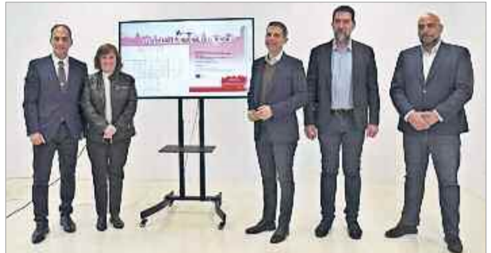
El objetivo del equipo de Gobierno del Ayuntamiento de Alcalá de Henares es ofrecer a todos los vecinos las herramientas posibles para que aumenten sus probabilidades de lograr un empleo.

Así, se refirió a los planes formativos que se han llevado a cabo por parte de este Ayuntamiento, a través de Alcalá Desarrollo y Ciudad Deportiva Municipal. En total, desde el año 2019 hasta el año 2022 ha habido 18 planes de empleo público y se han