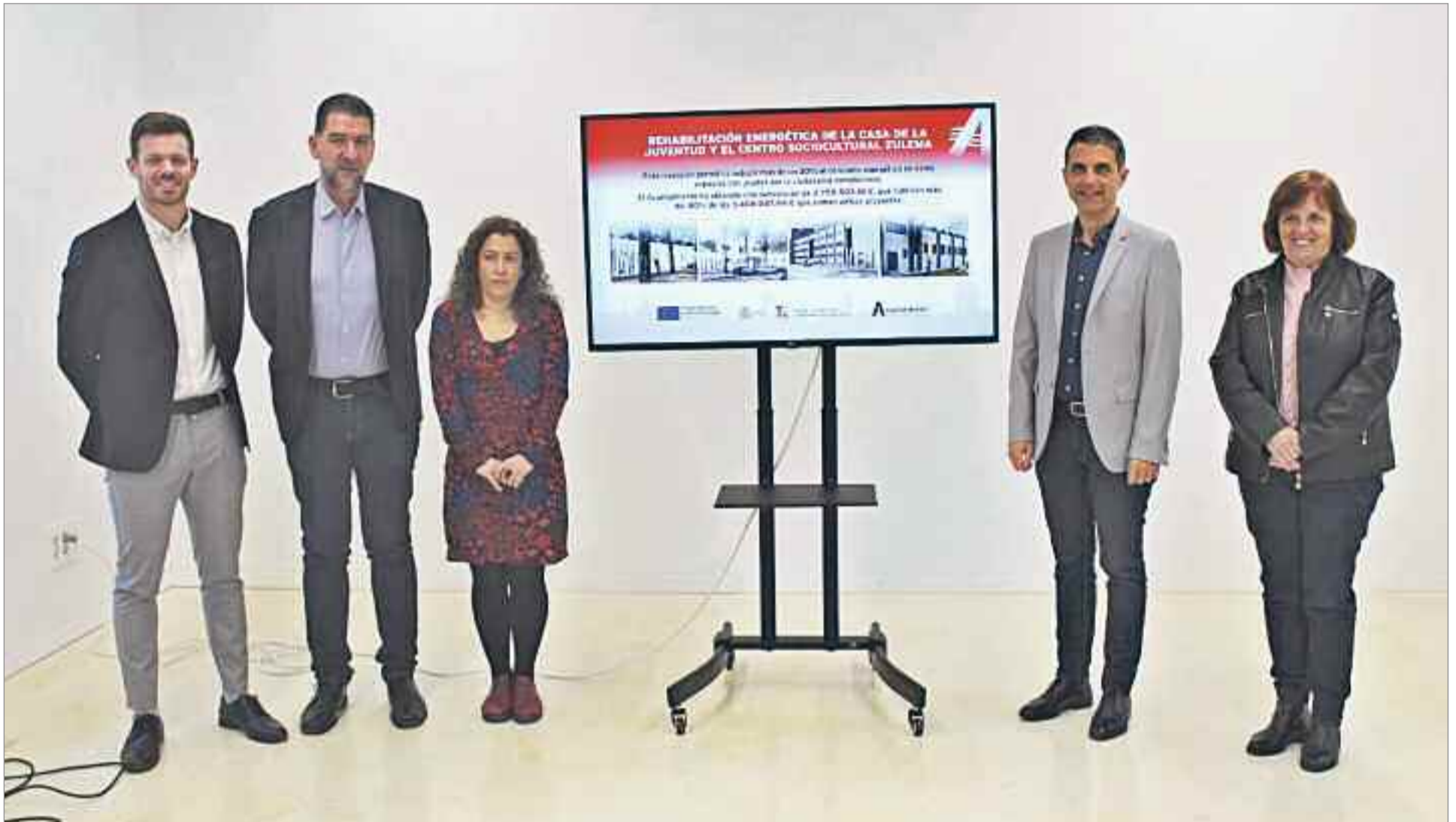
El equipo de Gobierno municipal del Ayuntamiento de Alcalá de Henares apostó por presentar dos proyectos a la convocatoria del PIREP (Programa de Impulso a la Rehabilitación Energética de los Edificios Públicos)

Se trata de dos espacios muy utilizados por la ciudadanía complutense, especialmente por el tejido asociativo y por los más jóvenes