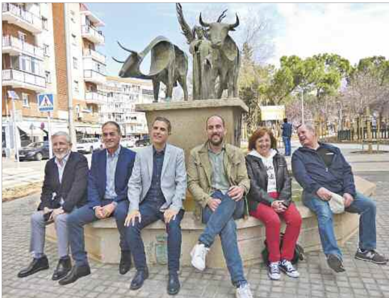
La estatua de San Isidro Labrador se ha integrado en el parque para darle un mayor protagonismo ganando nuevos espacio para la ciudadanía

En las obras de remodelación del parque, que han supuesto la intervención en una superficie de 12.400 metros cuadrados, se ha construido una nueva glorieta en la confluencia entre las calles Goya y Eras de San Isidro para favorecer la movilidad y conectar el entorno con los diferentes ejes de movilidad, y se reordenarán y crearán nuevas plazas de aparcamiento. La estatua de San Isidro Labrador se ha integrado en