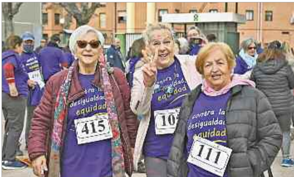
El objetivo es poner de manifiesto la necesidad de igualdad entre hombres y mujeres en todos los ámbitos