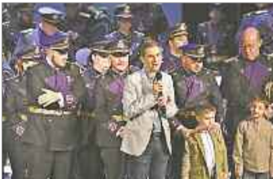
El alcalde, recibió en el Salón de Plenos del Ayuntamiento a los miembros de la Agrupación Musical de Jesús de Medinaceli