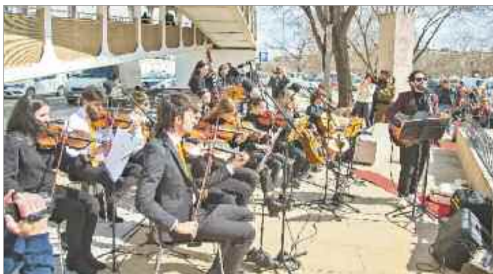
El alcalde destacó que es un día que toca el corazón especialmente en la ciudad por lo que sufrieron muchos vecinos