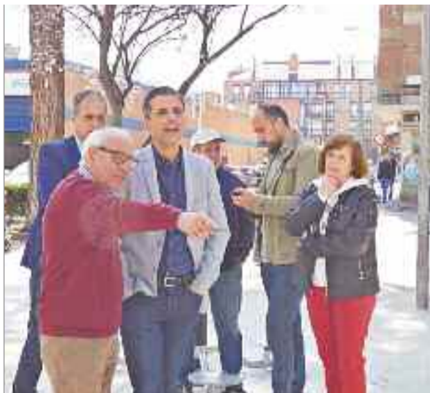
Las obras de remodelación del Parque de San Isidro han supuesto la intervención en una superficie de 12.400 metros cuadrados