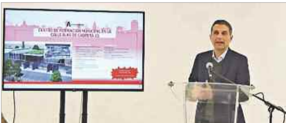
El alcalde precisó que desde que tomó posesión en el año 2015, el paro ha descendido en Alcalá en más de un 40%

También se refirió a la importancia del deporte en Alcalá y al apoyo que le brinda el Ayuntamiento, y explicó que los trabajos que se acometerán en el Juncal “provienen de unos fondos europeos que fueron los primeros que conseguimos en 2016, están llegando a su fin y están transformando la vida del distrito II a través de la estrategia EDUSI” . “La economía en Alcalá de Henares va bien, es preocupación de este equipo de Gobierno el desarrollo económico de la ciudad y lo estamos consiguiendo, como lo prueban los datos, y también que el Distrito II fue y es tan importante para nosotros, que focalizamos los fondos europeos del EDUSI exclusivamente en él, y que ha cambiado radicalmente desde el año 2015” , apostilló.