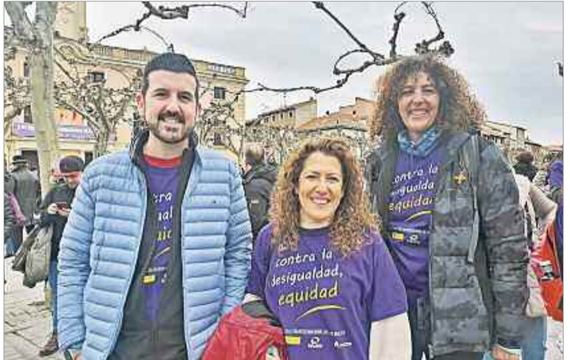
Se trata de un Plan de Igualdad que nace con el propósito de incorporar a la cultura corporativa la perspectiva de género en todos los ámbitos del Ayuntamiento, y servir de herramienta para alcanzar la Igualdad entre los y las trabajadoras de la Corporación Municipal.