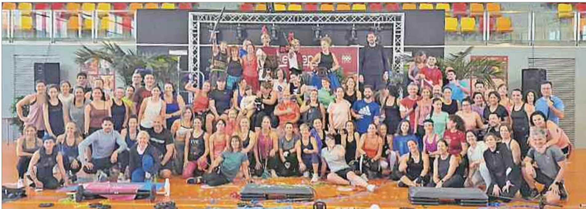
El Complejo Deportivo Espartales se vistió con sus mejores galas para celebrar el quinto aniversario del Carné Abonado Multideporte, donde Alcalá de Henares vivió una gran fiesta del deporte