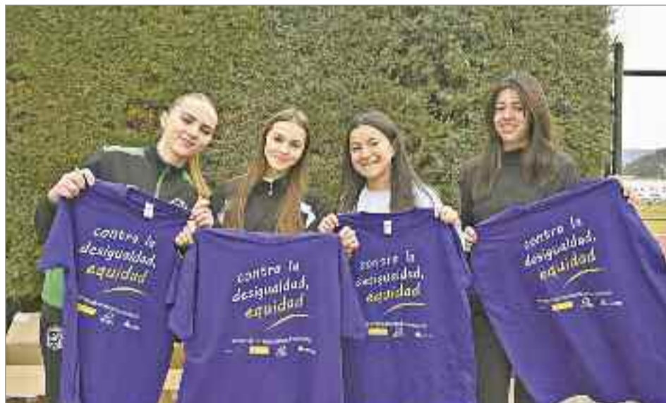
La Milla por la Igualdad volvió a recorrer las calles de Alcalá de Henares para concluir en la Plaza de Cervantes