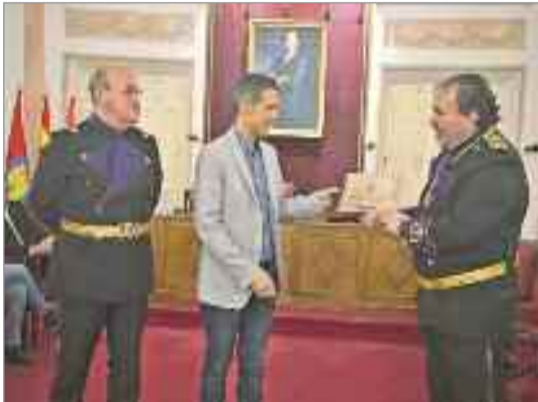
Este encuentro fue preludio de la Semana Santa de Alcalá