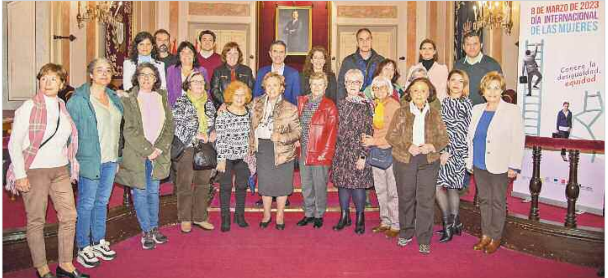
A la lectura asistieron mujeres que forman parte de las distintas asociaciones con presencia en la ciudad y que después participaron en una visita guiada en la que, bajo el título 'La mujer en la historia de Alcalá'

El alcalde de Alcalá de Henares, Javier Rodríguez Palacios, leyó en el Salón de Pleno del Ayuntamiento de la ciudad una declaración institucional, con motivo de la celebración del 8 de marzo, Día Internacional de las Mujeres, que contó con el apoyo de los grupos municipales del PSOE, Ciudadanos, Partido Popular y Unidas Podemos, excepto VOX. Rodríguez Palacios apeló a la necesidad “de ponernos todos del mismo lado porque a veces hay ciertas divisiones y problemas, pero creo que tenemos muchísimas más cosas que nos unen en la causa del feminismo y hay que apartar las posibles diferencias y reivindicar de una manera clara y fuerte el 8 de marzo como se viene reivindicando desde hace años y como se debe hacer en el futuro” . A la lectura asistieron mujeres que forman parte de las distintas asociaciones con presencia en la ciudad y que después participaron en una visita guiada en la que, bajo el título 'La mujer en la historia de Alcalá', recorrieron lugares emblemáticos de la ciudad como la plaza de Cervantes, la plaza de las Bernardas, la Capilla del Oídor o el Convento de las Carmelitas. A través de estos lugares, conocieron la historia de mujeres relevantes en la historia de Alcalá como Catalina de Aragón, una reina nacida en