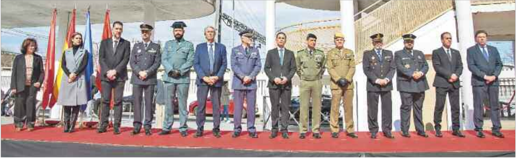
Al acto de asistieron el alcalde, el portavoz municipal del PSOE, el portavoz de Ciudadanos, la portavoz del PP, el portavoz de Vox, la portavoz de IU, así como el resto de la corporación

El alcalde destacó que este día “toca el corazón especialmente en la ciudad por lo que sufrieron muchos vecinos y vecinas”.